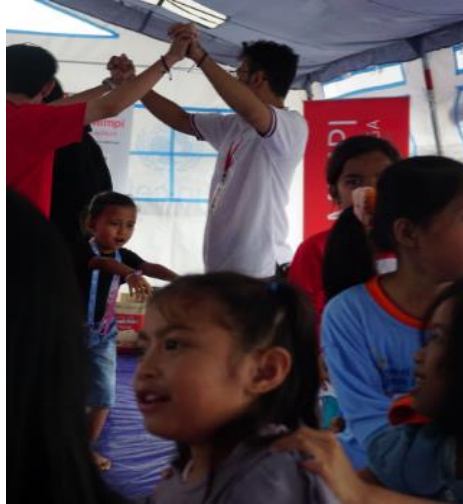
Keterangan: Salah satu Kegiatan Therapy Play