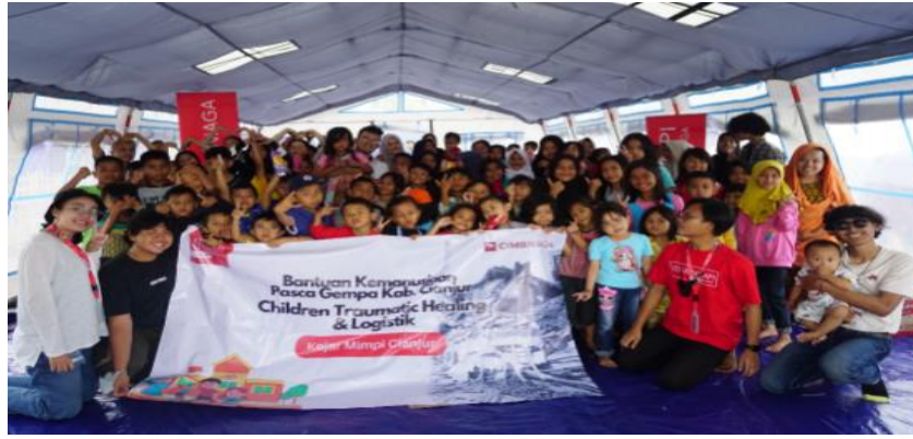
Keterangan: Kegiatan Trauma Healing KM Cianjur