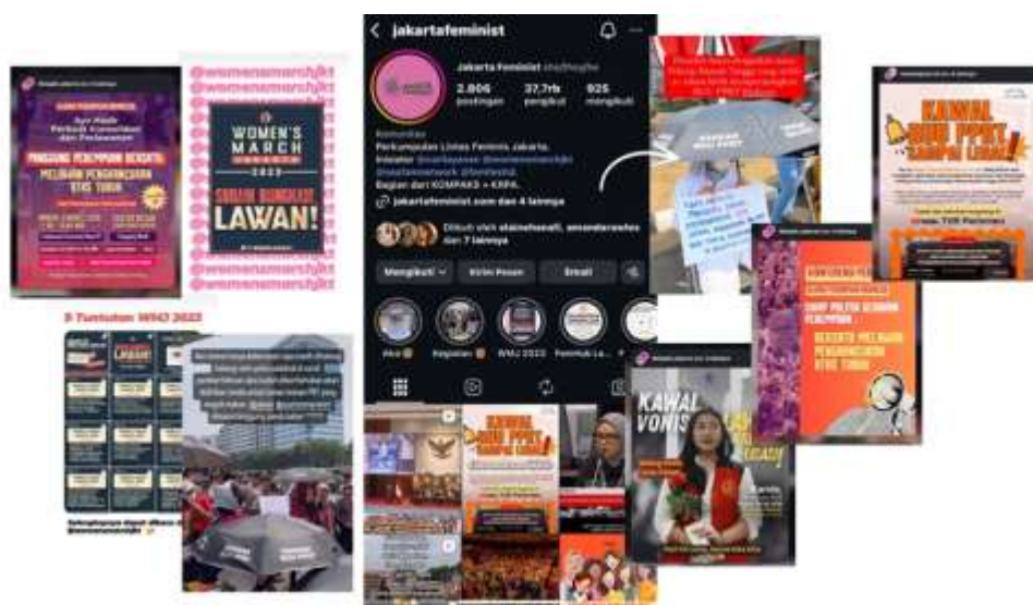
Gambar 2. Akun Instagram Jakarta Feminist