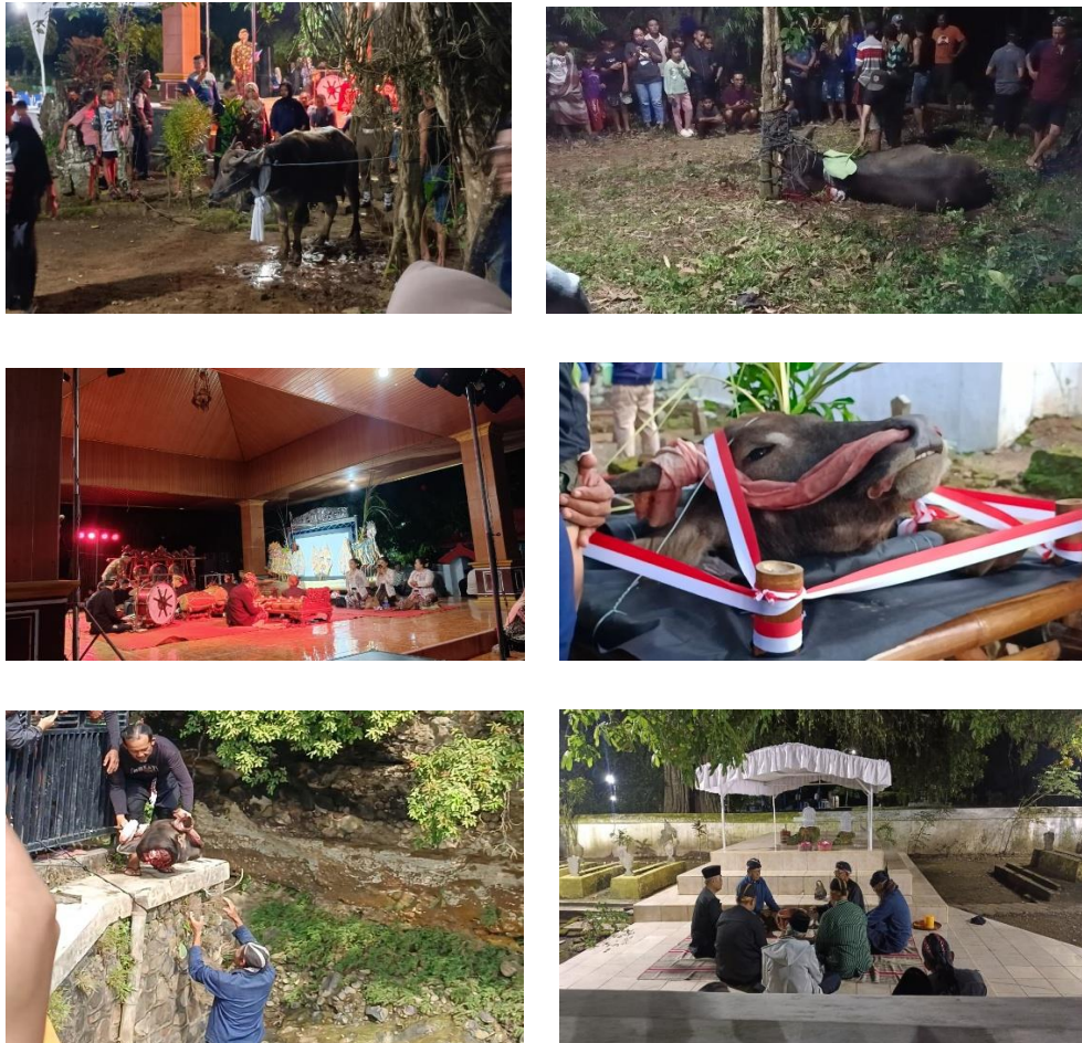
Gambar 2. Prosesi tradisi nyadran di Dam Bagong, 7-8 Mei 2026.

memandikan kerbau hingga bersih lalu menyerahkannya kepada juru pelihara menjadi simbol hubungan manusia dengan alam yang harus dijaga dengan baik. Tradisi ini juga mengingatkan masyarakat agar sumber daya alam seperti air digunakan secara bertanggung jawab dan tidak dirusak.