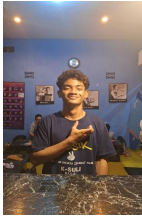
Gambar 4. Proses Pembuatan SOPT