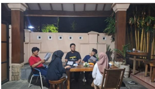
Gambar 3. Wawancara Calon Karyawan Bersama Teman K-SULI

Proses rekrutmen diikuti oleh beberapa orang yang menunjukkan minat untuk bergabung dengan K-SULI. Pada foto di atas, merupakan bagian dari proses rekrutmen yaitu tahap wawancara dengan calon karyawan baru K-SULI. Wawancara dilakukan oleh owner , karyawan K-SULI, dan perwakilan dari Tim Promahadesa.