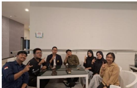
Gambar 1. Penjalinan Kemitraan HIMPALUBI UNIPAR