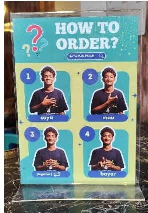
Gambar 5. SOPT K-SULI