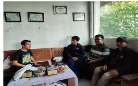
Gambar 2. Pertemuan dengan PERPENCA

Penjalinan mitra dilakukan oleh tim Promahadesa dengan menemui lembaga – lembaga guna mencapai tujuan menghadirkan kolaborasi dan upaya dukungan terciptanya K-SULI yang inklusif partisipatoris. Kedua foto di atas merupakan proses penjalinan kemitraan dengan perwakilan Himpunan Mahasiswa Pendidikan Luar Biasa