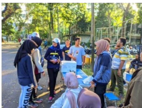
Gambar 8. Pemasaran Sosial Melalui CFD di Wilayah Universitas Jember