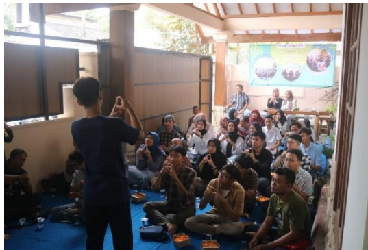
Gambar 10. Kelas Bahasa Isyarat “BERBISIK”

Program BERBISIK ini dapat memberikan manfaat terhadap masyarakat sekitar dan lebih luas, sehingga dapat terlaksanakannya lingkungan yang inklusif dan ramah bagi teman tuli. Kegiatan ini, tidak hanya memberikan kontribusi kepada masyarakat sekitar saja namun memperluas jangkauan K-SULI agar semakin dikenal di lingkungan masyarakat.