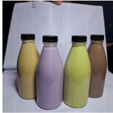
Gambar 7. Hasil Inovasi Produk

Pada gambar diatas, Inovasi produk dilakukan dengan memperbarui empat varian minuman pokok, diantaranya Cappucino, matcha, taro dan rasa coklat. ini dilakukan sebagai bentuk upaya guna meningkatkan daya tarik konsumen. dengan adanya inovasi minuman kemasan susu botol ini, tidak hanya memberikan variatif melainkan dapat bersaing pada pasar online maupun offline serta dapat meningkatkan pendapatan penjualan usaha.