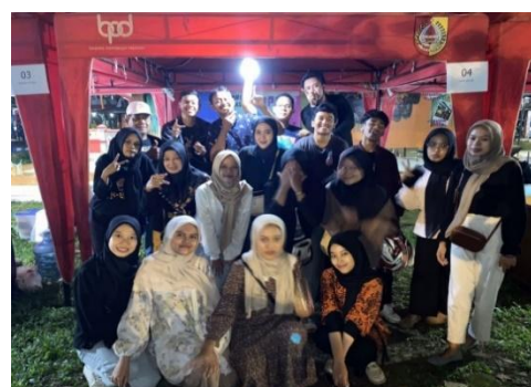
Gambar 9. Pemasaran Sosial Saat Event Fisip Empowering Day