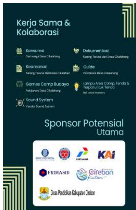
Gambar 3. Kolaborasi Pemangku Kepentingan dalam Perancangan Event.