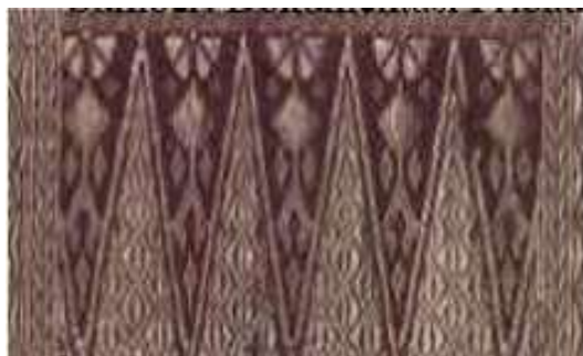
Gambar 5. Motif Songket.