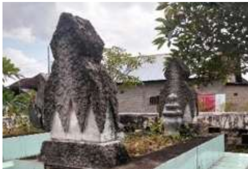
Gambar 4. Nisan Makam Pangeran Liting

Ragam hias adalah hasil kebudayaan yang berkembang dari pengalaman bersama suatu komunitas. Ia merepresentasikan cara pandang masyarakat terhadap alam di sekitarnya sekaligus menjadi wujud ekspresi nilai-nilai spiritual dan keyakinan yang mereka anut (Galih et al., 2026). Sumatera Selatan terkenal dengan songket yang dihasilkan dari proses menenun. Songket Palembang memiliki motif yang khas. Motif merupakan unsur ragam hias yang digunakan untuk memperindah serta menambah nilai estetika pada karya kerajinan yang bersifat statis. Sejak masa lampau hingga kini, keberadaan motif tetap dipertahankan sebagai elemen dekoratif, meskipun dalam praktiknya dapat mengalami penyesuaian sesuai perkembangan zaman dan kreativitas pembuatnya. Terdapat jenis-jenis ragam hias antara lain flora, geometris, fauna, tumpal dan pilin berganda. Salah satu makam yang terdapat di Sumatera Selatan yaitu Kawah Tengkreup, ragam hias di makam tersebut memiliki motif-motif yang dilangsungkan pada motif yang ada di songket. Pada makam tersebut terdapat 4 motif songket yang merupakan kerajinan asli Palembang yaitu motif pola tumpal (pucuk rebung), motif kandang (meru), motif geometris, dan motif berantai (Pratama et al., 2021).