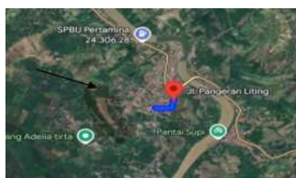
Gambar 1. Peta penelitian.

Lokasi pada penelitian ini pada Makam Pangeran Liting yang beralamat di Jalan Pangeran Liting, Kecamatan Tanjung Raja, Kabupaten Ogan Ilir, Sumatera Selatan. Waktu penelitian tanggal 25 Januari 2026.