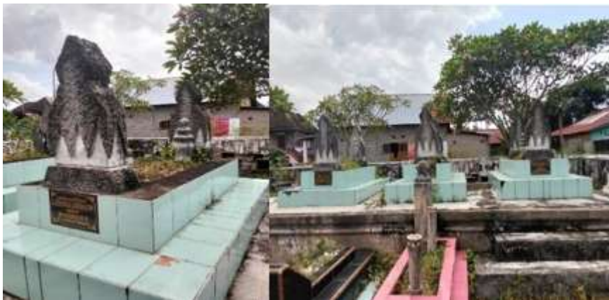
Gambar 3. Makam Pangeran Liting.

Jirat yang juga dikenal dengan istilah kijing merupakan bagian dasar atau pondasi awal yang berfungsi sebagai penanda keberadaan sebuah makam. Bagian ini umumnya dibuat dalam bentuk persegi panjang sebagai pembatas area makam (Susanti et al., 2022). Pada makam pangeran Liting dibuat dengan konstruksi yang ditinggikan dari permukaan tanah dan dilapisi keramik berwarna hijau muda pada bagian luar.