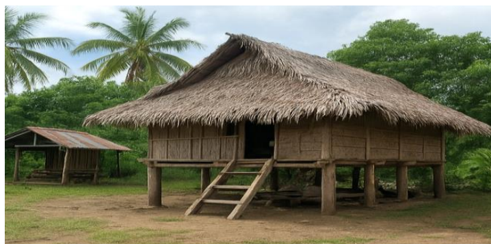
Gambar 2 Dokumentasi Rumah Tradisional Desa Luluo.

Peta ini menggambarkan sebaran rumah penduduk, jaringan jalan, ruang terbuka, dan fasilitas umum di Desa Luluo. Pola permukiman terlihat berkembang dari pola mengelompok menuju linier seiring peningkatan infrastruktur jalan.