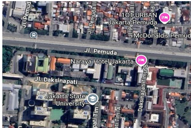
Gambar 8. Lokasi Kost Pemuda