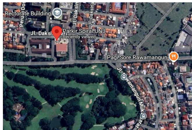
Gambar 7. Lokasi Kost Rawamangun Muka