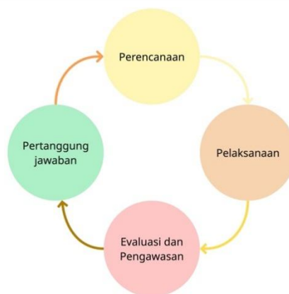
Gambar 1 : Alur Mekanisme Pengelolaan Dana.

Di Desa Sumurgenuk Lamongan, pengelolaan dana desa dilakukan melalui berbagai tahapan, termasuk perencanaan, pelaksanaan, evaluasi, dan pengawasan, hingga pertanggungjawaban. Setiap tahapan memiliki peran penting untuk memastikan bahwa dana dialokasikan secara transparan dan akuntabel serta memenuhi kebutuhan masyarakat. Mekanisme pengelolaan ini tidak hanya menekankan aspek administratif, tetapi juga menuntun partisipasi masyarakat secara luas.