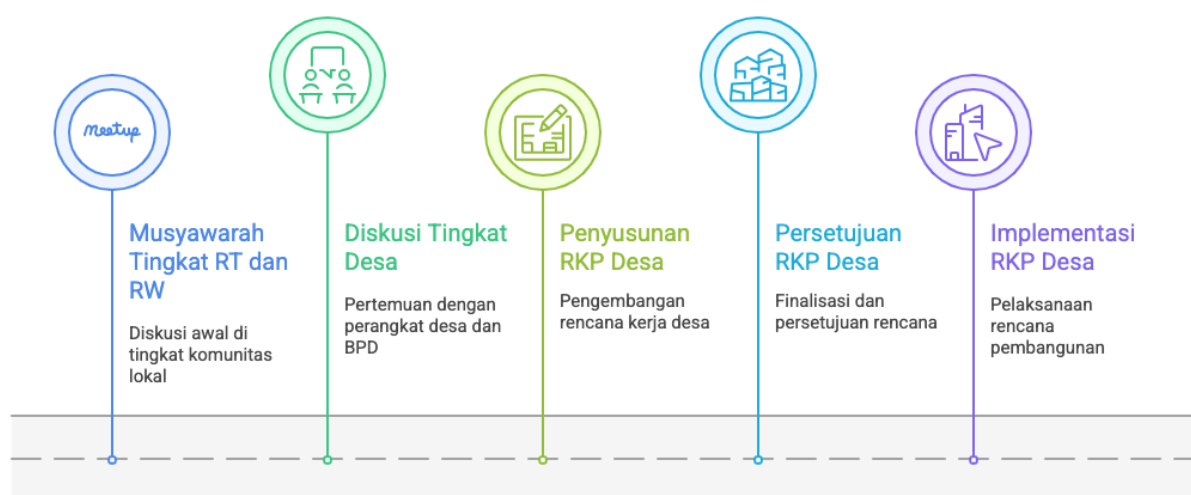
Gambar 2 : Alur Proses Perencanaan Dana Desa.

masyarakat dari berbagai unsur sosial. Forum ini berfungsi menyelaraskan aspirasi, menentukan prioritas pembangunan, serta memastikan keterlibatan seluruh pihak dalam proses pengambilan keputusan.