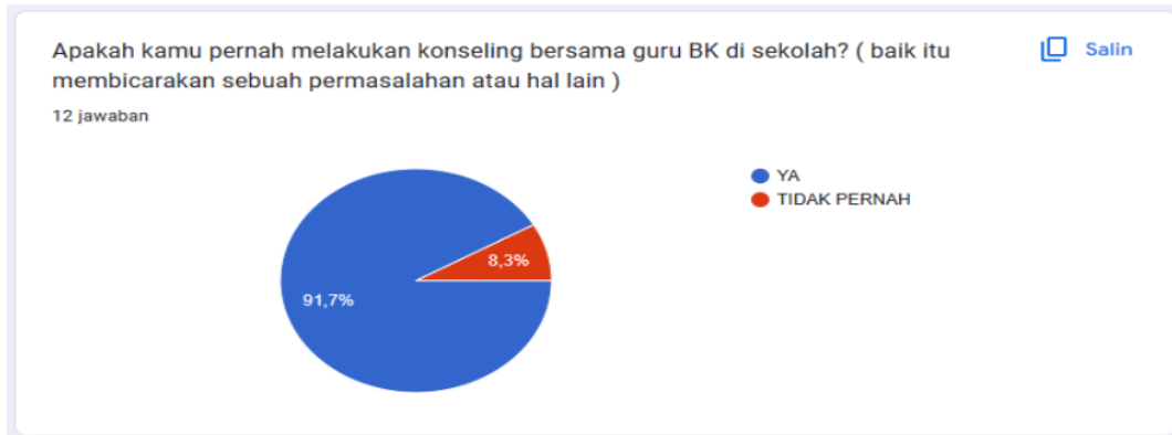
Gambar 2. Diagram Lingkaran Banyaknya murid yang melakukan konseling