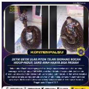
Gambar 1. Contoh informasi hoax

Dalam menentukan hoax yang perlu segera diperiksa kebenarannya, digunakan metode prioritas berdasarkan dua kriteria utama, yakni tingkat bahaya (severity) dan Urgensi (urgency). Hoax yang dinilai berpotensi bahaya dan memerlukan respon cepat akan diposisikan sebagai prioritas utama untuk dilaksanakannya debunk. Sementara itu hoax yang tidak membahayakan, seperti satire, dan lain-lain maka akan didebunk jika dirasa perlu saja dan jika ada resource yang mampu melaksakannya (dikutip dari mafindo.or.id) Maka dari itu, dibuat lah Lembaga TrunBackHoax.id ini agar masyarakat lebih aware terhadap informasi hoax yang sedang marak terjadi. Contoh informasi hoax pada gambar dibawah ini: