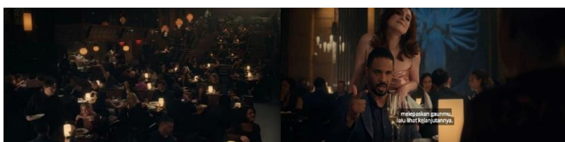
Gambar 1. Scene 6 (Tekanan sosial dan objektifikasi perempuan lajang) Menit ke – (08:02 – 08:44)

Penelitian ini secara khusus membahas representasi perempuan lajang berusia 40-an tahun dalam film Kinda Pregnant dengan menggunakan pendekatan teori semiotika yang dikembangkan oleh Roland Barthes. Analisis difokuskan pada 12 adegan kunci yang dipilih secara sistematis karena dianggap paling relevan dalam menggambarkan berbagai aspek pengalaman tokoh utama, Lainy. Adegan-adegan tersebut menyoroti tekanan sosial yang dialami perempuan lajang, stigma negatif yang melekat, proses pencarian identitas diri, serta perjalanan pemberdayaan diri yang dijalani oleh Lainy dalam menghadapi norma dan ekspektasi masyarakat.