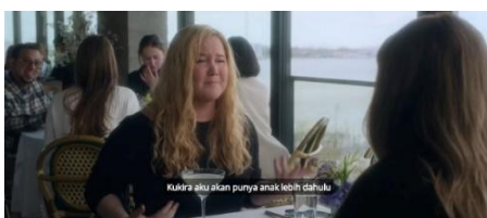
Gambar 2. Scene 9 (Kecemburuan dan terasingkan perempuan lajang) Menit ke – (13:37 – 14:29)

Di restoran, Dave dengan penuh harapan menyampaikan keinginannya kepada Lainy untuk menjalin hubungan yang lebih serius, sehingga membuat Lainy mengharapkan hubungannya dalam pernikahan. Namun, Dave secara mengejutkan memperkenalkan seorang perempuan lain bernama Moira kepada Lainy, sekaligus menawarkan agar Lainy terlibat dalam sebuah hubungan cinta segitiga. Situasi ini membuat Lainy merasa sangat kecewa dan terluka secara emosional, hingga akhirnya ia tidak dapat menahan perasaannya dan menangis di hadapan Dave, mengekspresikan kekecewaan mendalam atas perlakuan yang tidak sesuai dengan harapannya tersebut.