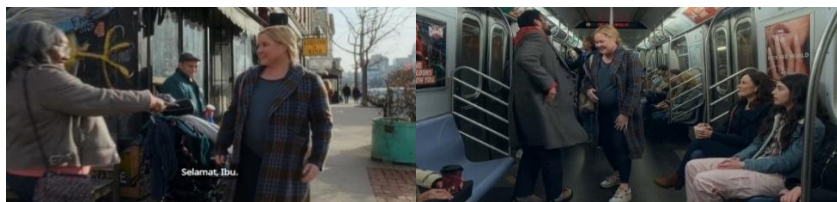
Gambar 6. Scene 17 (Citra perempuan ideal dan perlakuan istimewa pada ibu hamil) Menit ke – (25:45 – 26:41)

hangat semakin memperkuat imajinasi Lainy tentang kehidupan baru yang sedang ia bayangkan.