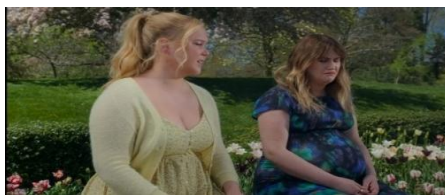
Gambar 11. Scene 34 (Standar kebahagiaan perempuan lajang) Menit ke – (01:17:35 – 01:17:48)

Lainy dengan jujur mengakui bahwa dirinya menyimpan perasaan cemburu dan iri terhadap kehamilan sahabatnya, Kate. Meskipun Lainy sempat menyembunyikan rahasia tersebut, Kate tidak merasa tersinggung, justru menunjukkan sikap pengertian dan menerima perasaan Lainy. Kate sangat mengharapkan kehadiran dan dukungan dari Lainy di sisinya selama masa kehamilan, karena dukungan tersebut dianggap penting untuk menghadapi tantangan dan perubahan yang dialaminya. Hubungan keduanya semakin diperkuat melalui saling pengertian dan kejujuran ini, yang menunjukkan betapa pentingnya solidaritas dan empati antar perempuan dalam menghadapi situasi yang kompleks secara emosional.