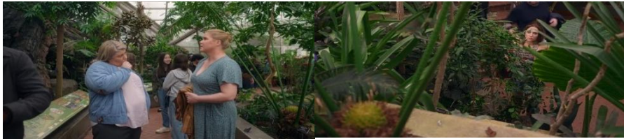
Gambar 9. Scene 31 (Ketakutan perempuan lajang terhadap penilaian sosial) Menit ke – (01:09:46 – 01:40:46)

Lainy menceritakan kebohongan palsu tentang kehamilannya kepada Fallon, rekan kerjanya. Fallon memberikan saran yang bijak sekaligus kritik yang jujur mengenai dampak dari kebohongan tersebut. Meskipun niat Fallon adalah membantu, kata-katanya membuat Lainy merasa bingung dan ragu, karena ia mulai menyadari betapa rumit dan beratnya konsekuensi yang harus dihadapi jika terus mempertahankan kebohongan itu. Perbincangan itu membuka ruang bagi Lainy untuk merenung lebih dalam tentang kejujuran dan keberanian dalam menghadapi masalahnya.