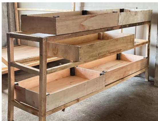
Gambar 5 Wadah pembesaran maggot

Program ini dilanjutkan dengan pembuatan instalasi budidaya meliputi wadah pembesaran (biopond), kandang indukan, dan tempat penempelan telur maggot. Wadah pembesaran maggot berbentuk persegi panjang yang terbuat dari kayu dengan ukuran 1 \times 0.5 \text{ m}^2 sebanyak 5 buah. Kandang maggot terbuat dari jaring hafa berbentuk balok berukuran 2 \times 1 \times 1 \text{ m}^3 , sedangkan tempat penempelan telur dibuat dengan menyusun kayu ukuran 30 cm secara bertingkat. Gambar 5, 6, dan 7 menunjukkan wadah pembesaran maggot, kandang BSF, dan tempat penempelan telur secara berurutan.