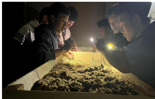
Gambar 10 Pengecekan maggot