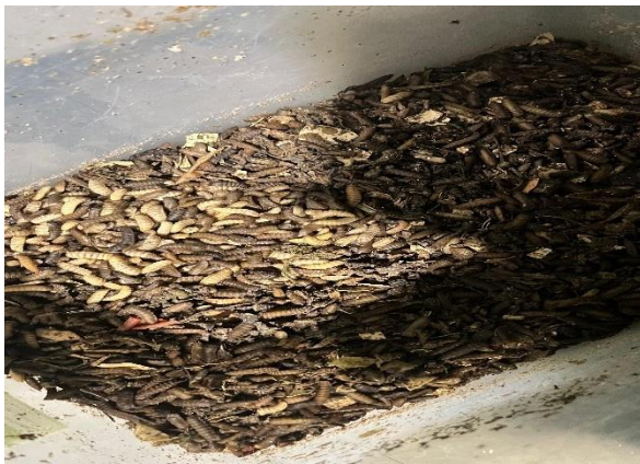
Gambar 8 Starter indukan BSF

dengan medianya. Pada wadah pembesaran tersebut ditambahkan serbuk kayu agar media tidak terlalu basah ketika ditambahkan pakan berupa sampah organik. Pemeliharaan maggot dilakukan dengan cara memberikan sampah organik setiap hari. Penyediaan indukan juga dilakukan dengan menyiapkan starter indukan BSF atau maggot yang telah berada pada fase pre pupa (Gambar 8). Starter indukan kemudian dipindahkan ke dalam galon yang diletakkan di dalam kandang dan ditunggu selama 10 hari sampai menetas. Selain itu, kandang indukan juga dilengkapi dengan daun pisang kering dan tempat penempelan telur. Pemeliharaan indukan maggot hanya dilakukan dengan menyemprotkan air ke daun pisang kering dan sekitar kandang maggot. Hasil yang didapatkan pada siklus pertama budidaya maggot adalah larva berumur 2 minggu dan telur BSF (Gambar 9). Pengecekan maggot (Gambar 10) dilakukan setiap hari bersama dengan masyarakat untuk memantau ketersediaan pakan dari maggot.