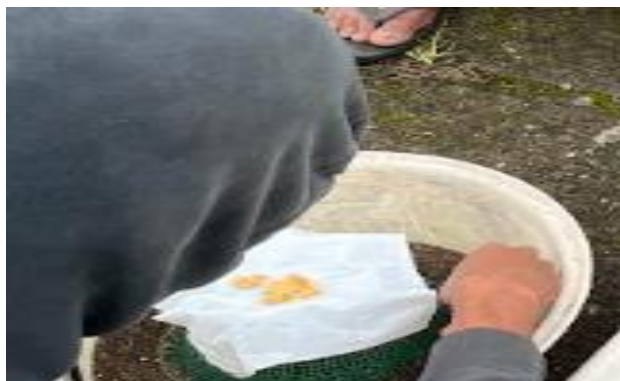
Gambar 4 Tahap penetasan telur BSF

Program ini dilanjutkan dengan pembuatan instalasi budidaya meliputi wadah pembesaran (biopond), kandang indukan, dan tempat penempelan telur maggot. Wadah pembesaran maggot berbentuk persegi panjang yang terbuat dari kayu dengan ukuran 1 \times 0.5 \text{ m}^2 sebanyak 5 buah. Kandang maggot terbuat dari jaring hafa berbentuk balok berukuran 2 \times 1 \times 1 \text{ m}^3 , sedangkan tempat penempelan telur dibuat dengan menyusun kayu ukuran 30 cm secara bertingkat. Gambar 5, 6, dan 7 menunjukkan wadah pembesaran maggot, kandang BSF, dan tempat penempelan telur secara berurutan.