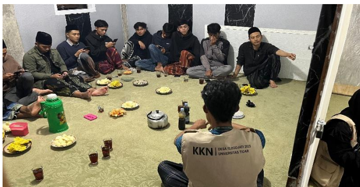
Gambar 1 Sosialisasi pengolahan sampah organik

Program sosialisasi pengolahan sampah organik terdiri atas dua materi, yaitu pembuatan ekoenzim dan budidaya maggot. Setiap kegiatan sosialisasi diikuti dengan penyampaian materi dan praktik langsung. Materi yang disampaikan untuk ekoenzim terdiri atas definisi umum, manfaat, dan tata cara pembuatannya. Materi mengenai budidaya maggot terdiri atas definisi umum, siklus hidup maggot, manfaat, instalasi budidaya, dan teknik budidaya. Setiap sesi pemaparan materi dilanjutkan dengan sesi diskusi oleh peserta. Kegiatan sosialisasi dilanjutkan dengan praktik langsung bersama peserta sehingga peserta mampu mengetahui dan memahami secara jelas materi yang telah disampaikan. Gambar 1 menunjukkan kegiatan sosialisasi pengolahan sampah organik bersama masyarakat.