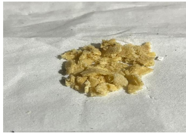
Gambar 9 Telur BSF