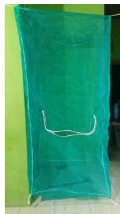
Gambar 6 Kandang maggot