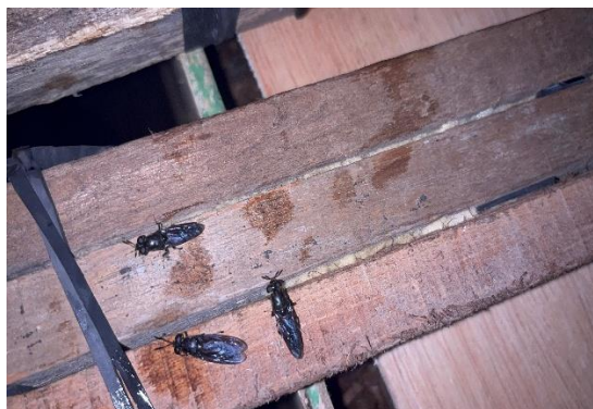
Gambar 7 Tempat penempelan telur

Maggot yang telah menetas kemudian dipindahkan ke wadah pembesaran bersama