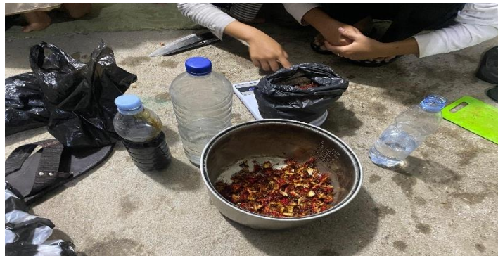
Gambar 3 Praktik pembuatan ekoenzim

Pembuatan ekoenzim dilanjutkan dengan memperkecil limbah organik dan penimbangan setiap bahan. Komposisi yang digunakan dalam pembuatan ekoenzim adalah 1:3:10 (molase:limbah:air). Langkah terakhir adalah dengan mencampurkan setiap bahan ke dalam wadah fermentasi yang terdiri dari molase, air, dan limbah sayuran/buah-buahan secara berurutan. Gambar 3 menunjukkan kegiatan praktik langsung pembuatan ekoenzim.