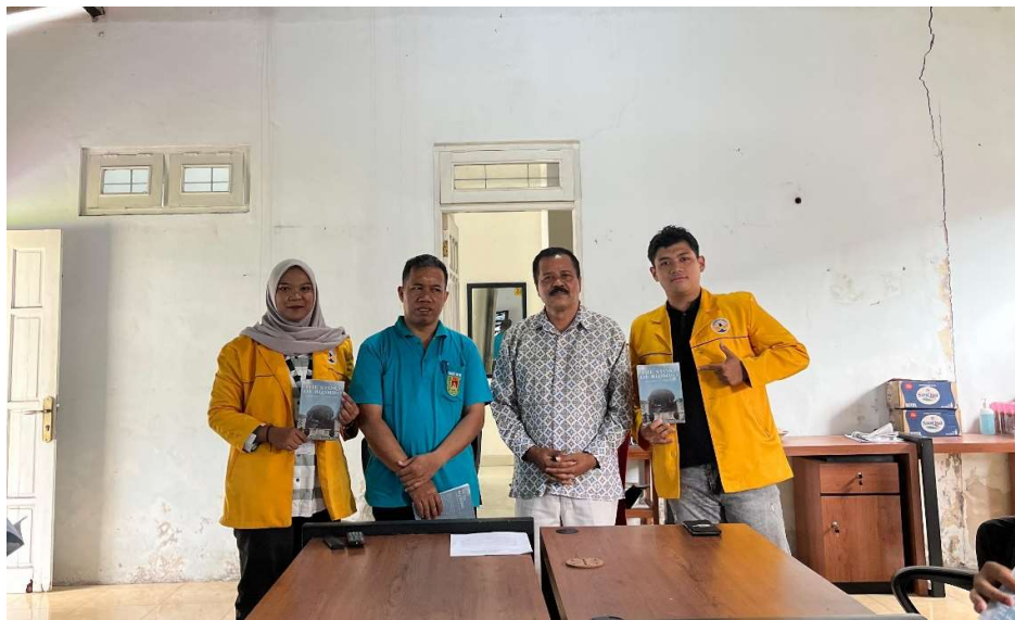
Gambar 2. Penyerahan Buku Kepada Kepala Desa Blondo