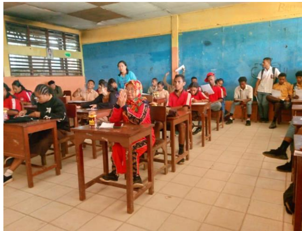
Gambar 2. Kegiatan Pengabdian Proses Kegiatan