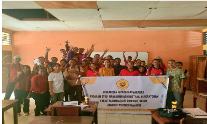
Gambar 2. Kegiatan Pengabdian Foto Bersama