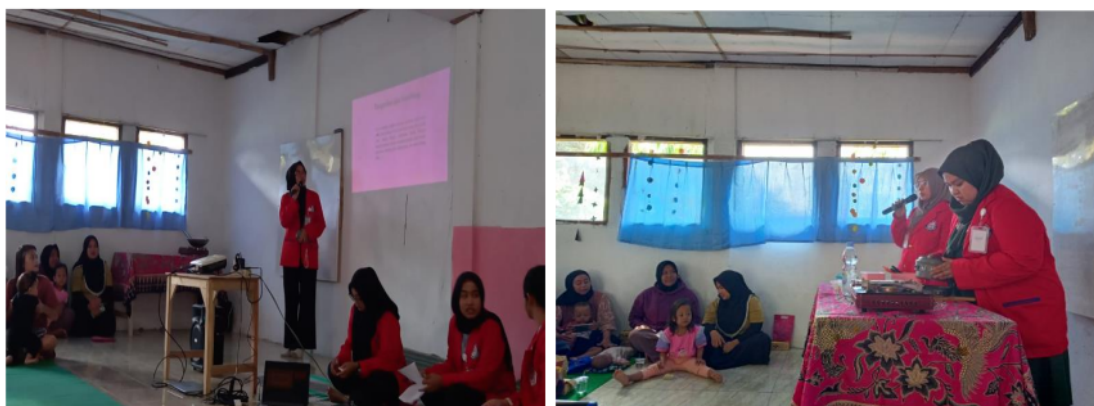
Gambar 1. Kegiatan Penyuluhan Kesehatan & Simulasi Pengolahan Makanan