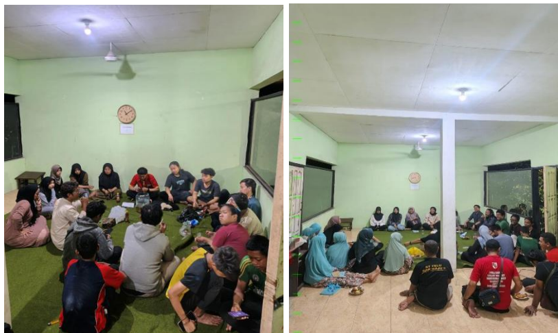
Gambar 4. Focus Group Discussion (FGD) Bersama Komunitas Lokal.

Kegiatan ini juga memperlihatkan peningkatan peran kelembagaan lokal. Karang Taruna Arkidli menjadi penggerak utama dalam mengorganisasi kampanye edukasi lingkungan di kalangan pemuda. Posga Venus dan Posga Bumi mulai mengintegrasikan edukasi pemilahan sampah dalam kegiatan posyandu keluarga, sementara PKK dan KSH melakukan pencatatan keuangan sederhana dari hasil penjualan produk daur ulang. Rata-rata tambahan kas kelompok mencapai Rp200.000–Rp400.000 per bulan, yang digunakan untuk kegiatan sosial dan kebersihan lingkungan.