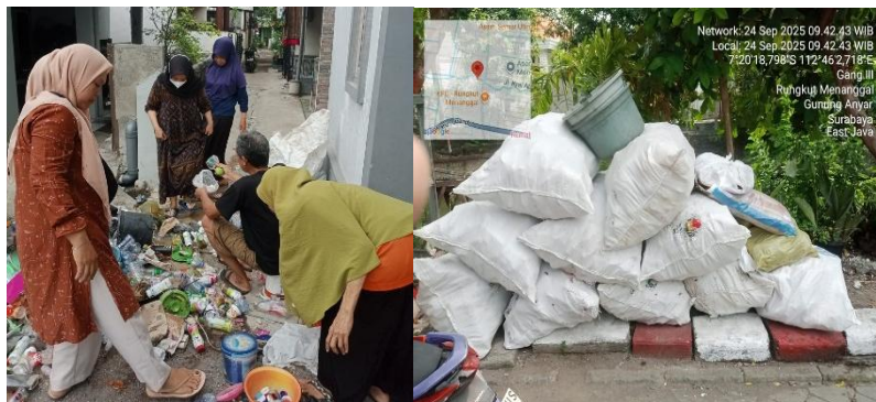
Gambar 5. Kegiatan Pemilahan Sampah Oleh Para Masyarakat.

Dampak paling terlihat dari kegiatan ini adalah perubahan perilaku masyarakat terhadap pengelolaan sampah. Jika sebelumnya mayoritas warga mencampur sampah rumah tangga dan sebagian membuangnya ke sungai, kini sekitar 60% keluarga di RW pengguna bank sampah telah melakukan pemilahan secara rutin. Hal ini memperkuat hasil penelitian Ariescy, Pratiwi, dan Utami (2025) yang menunjukkan bahwa edukasi lingkungan berbasis komunitas dapat meningkatkan perilaku pemilahan sampah secara signifikan.