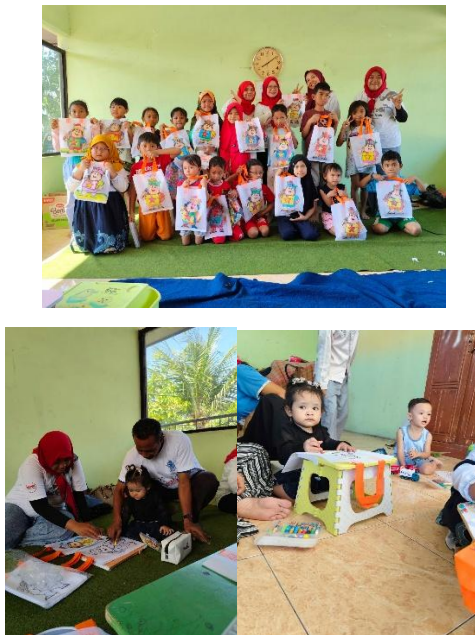
Gambar 3. Pelatihan Pembuatan Tas Dari Barang Bekas.

Saputra (2025), yang menyatakan bahwa pengelolaan sampah rumah tangga melalui daur ulang memberikan nilai ekonomi tambahan bagi keluarga.