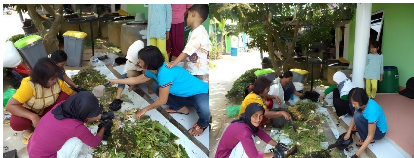
Gambar 2. Pelatihan Pembuatan Kompos Dari Sampah Organik.

Sebelum kegiatan dilakukan, bank sampah di dua RW di Kelurahan Rungkut Menanggal belum berfungsi secara optimal karena partisipasi masyarakat masih terbatas. Setelah dilakukan pendampingan, masyarakat mampu meningkatkan aktivitas pengelolaan sampah rumah tangga, terutama pada tahap pemilahan dan pengolahan. Dalam pelatihan pembuatan kompos, ibu-ibu PKK berhasil mengolah sekitar 100 kg sampah organik dalam satu siklus menjadi kompos yang dimanfaatkan untuk kebun rumah tangga dan dijual dengan harga Rp3.000–Rp5.000/kg.